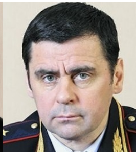
Миromov 200 семей ЖК "Олимпийский"