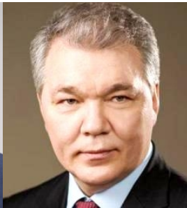
Калашников Обращаюсь к Вам за содействием из Приднестровья