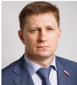
Фургал Защита прав детей

Посмотреть все Сегодня На этой неделе Последние ответы