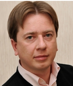
Бурматов Нарушение закона против животного